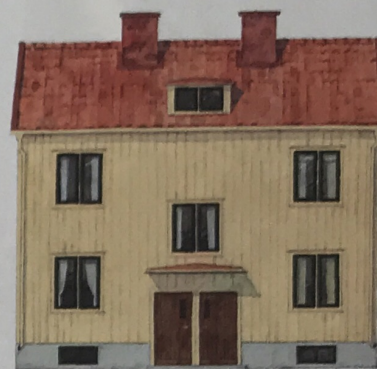
1950-tal: Väggar i samma kulör som foder och vindskivor, målade med järnoxidgul linoljefärg. Fönsterbågar i oxidgrön linoljefärg.