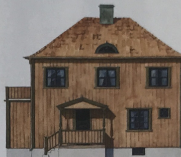
1920-tal: Väggarna är färgade med pigment av gulockra, foder och knutar av obränd umbra och fönster i oxidgrönt.