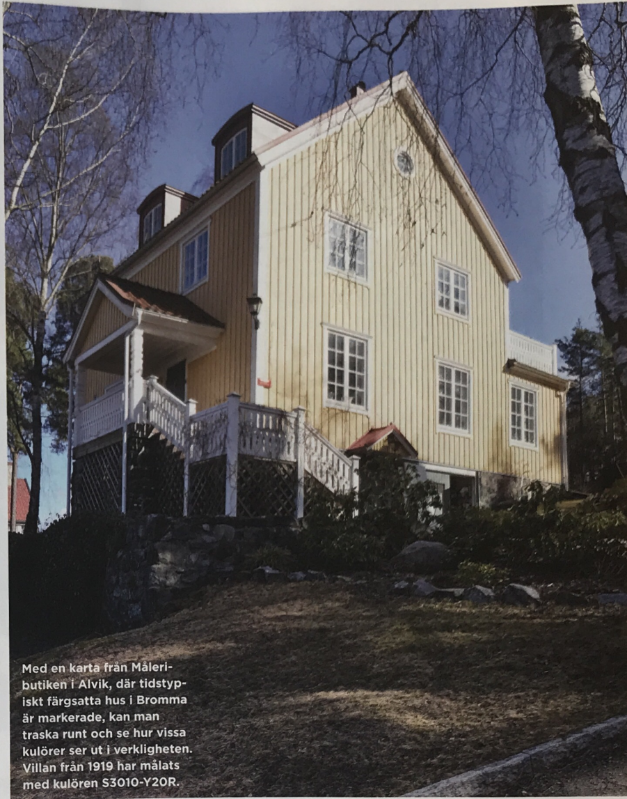
Med en karta från Måleributiken i Alvik, där tidstypiskt färgsatta hus i Bromma är markerade, kan man traska runt och se hur vissa kulörer ser ut i verkligheten. Villan från 1919 har målats med kulören S3010-Y20R.

knutar beror dels på att man ville få de enklare boningarna att efterlikna fina tegelklädda herresäten, dels på att den röda slamfärgen var lätt att få tag på och dessutom billig. (Och så var den förstas också bra på att skydda träfasaden mot väder och vind.)