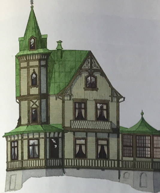
Snickarglädje från slutet av 1800-talet. Både väggar och detaljer färgsatta med grönjord linoljefärg i olika koncentrationer. Fönster och dörrar i engelskt rött.