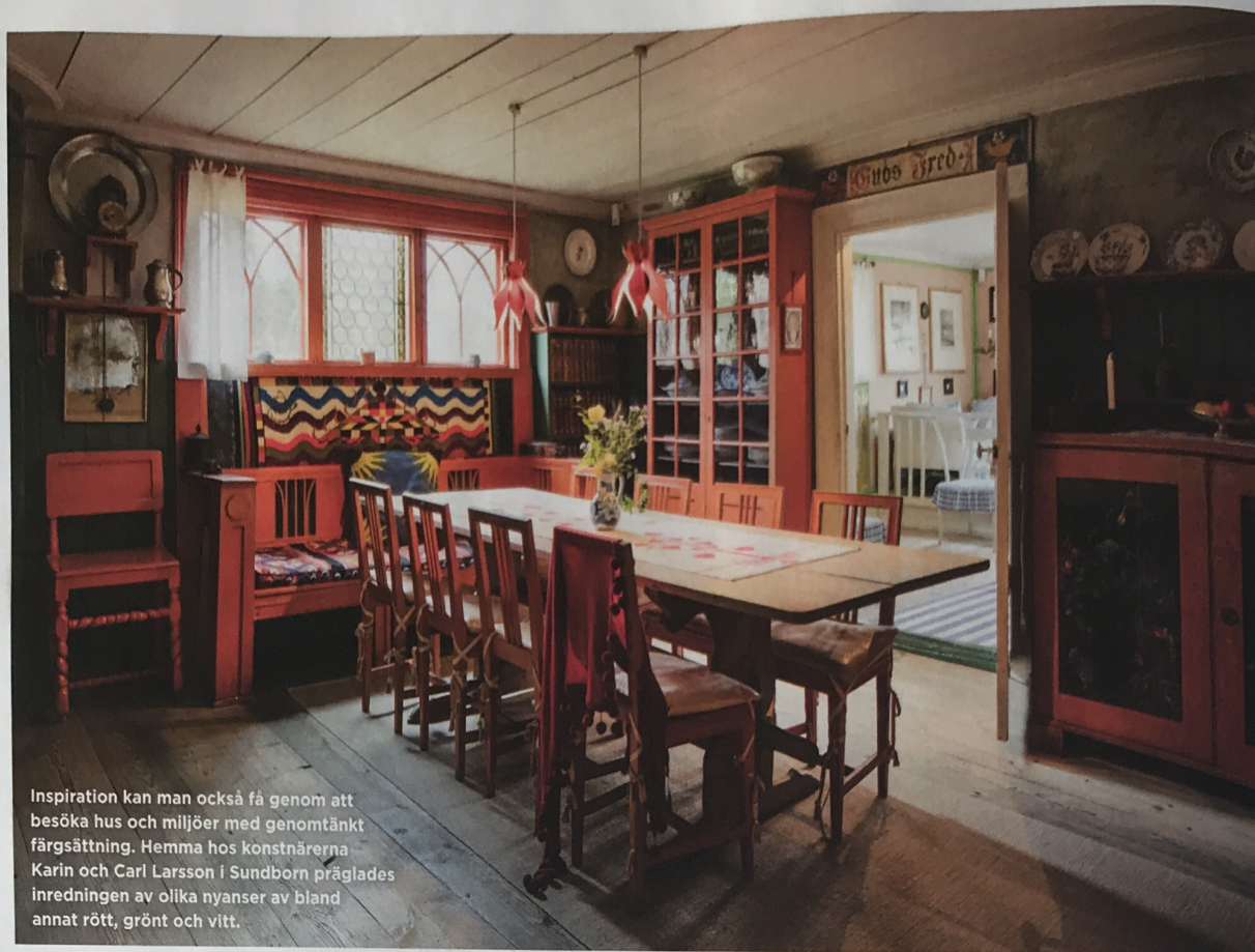
Inspiration kan man också få genom att besöka hus och miljöer med genomtänkt färgsättning. Hemma hos konstnärerna Karin och Carl Larsson i Sundborn präglades inredningen av olika nyanser av bland annat rött, grönt och vitt.