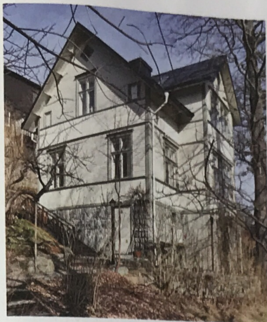
Villan från 1909 har målats i kulören "Varmgrå" från Måleributiken i Alviks kollektion.