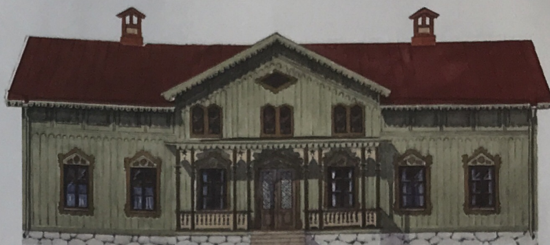
Hus i schweizerstil från andra hälften av 1800-talet med fasad i flera kulörer. Väggar i grönjord-nyans, fönsterfoder i gulockra och fönsterbågar i järnoxidbrunt. Lövsågerier på verandan i svag gulockra.