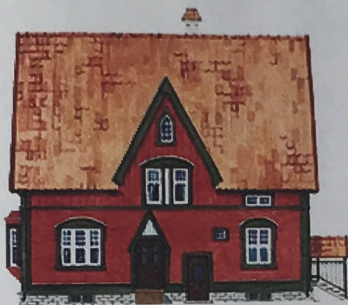
Hus från tidigt 1900-tal i nationalromantisk stil. Med fasad målad i röd slamfärg eller järnoxidröd linoljefärg. Foder, knutar och vindskivor i grönjord linoljefärg.