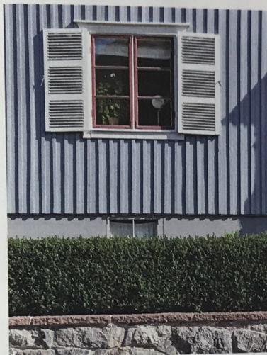
Måleributiken i Alvik har tagit fram en färgkollektion med ca 200 kulörer som använts i äldre villaförorter i Stockholmstrakten. Villan från 1928 har målats med S4005-R80B.