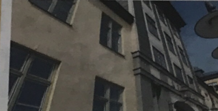
Början. Begreppet "Norrköpingsgult" har sina rötter i Holmentorret. Även om det är ljusare gult än många andra varianter av "Norrköpingsgult".